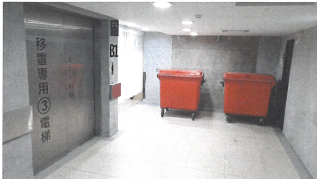
B1移靈三號電梯口處