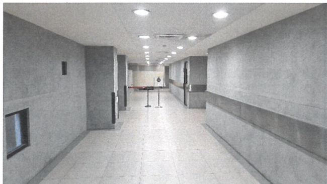
B1暫冰存專案火化排隊區