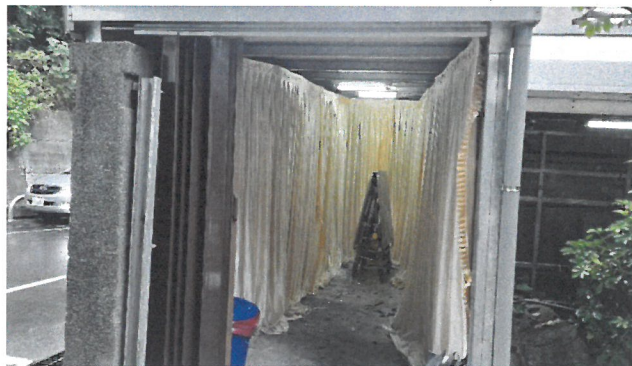
臨時簡易入殮區、防護衣配備卸除區