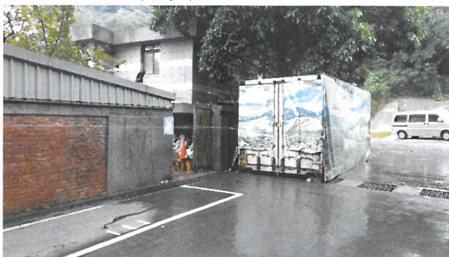
火化場後方專屬車位