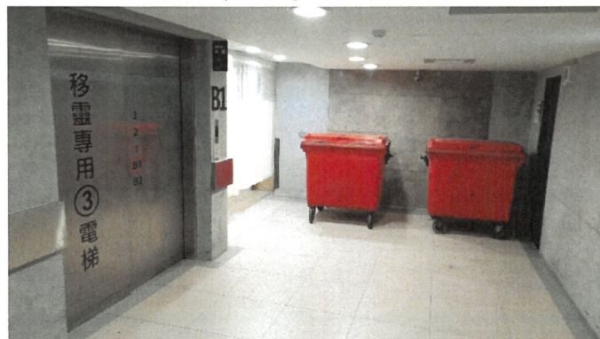
B1移靈三號電梯口處