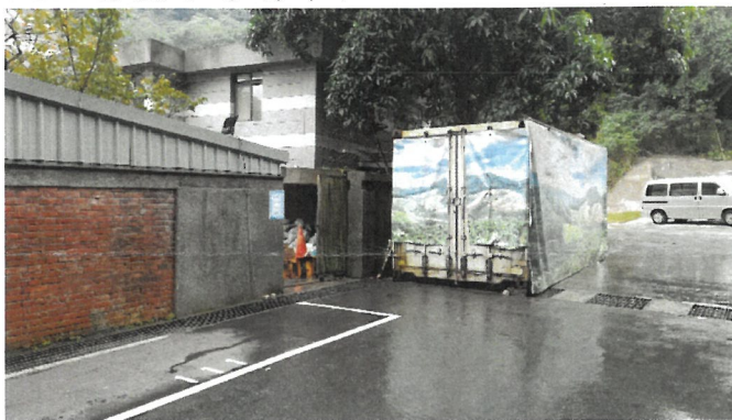
火化場後方專屬車位