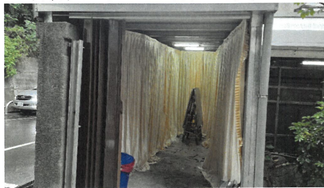
臨時簡易入殮區、防護衣配備卸除區