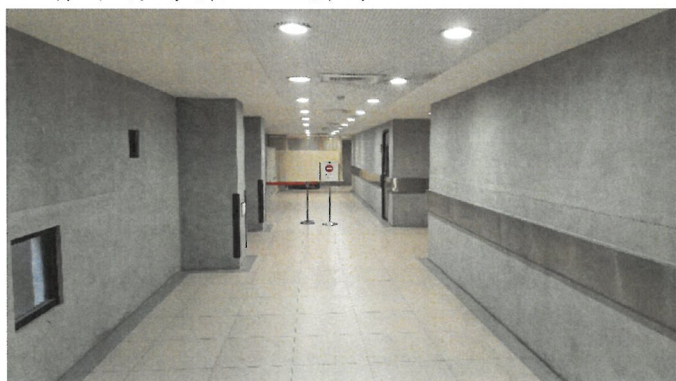
B1暫冰存專案火化排隊區